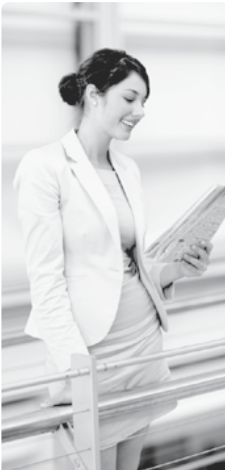
Посао се не чена, посао се тражи