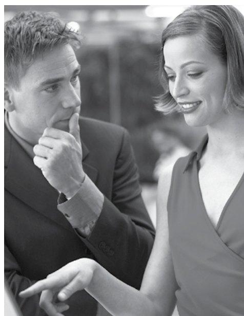
Пословни центри НСЗ