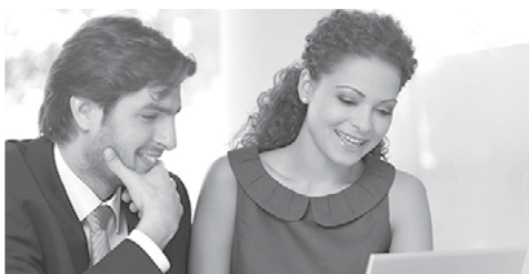
Пословни центри НСЗ