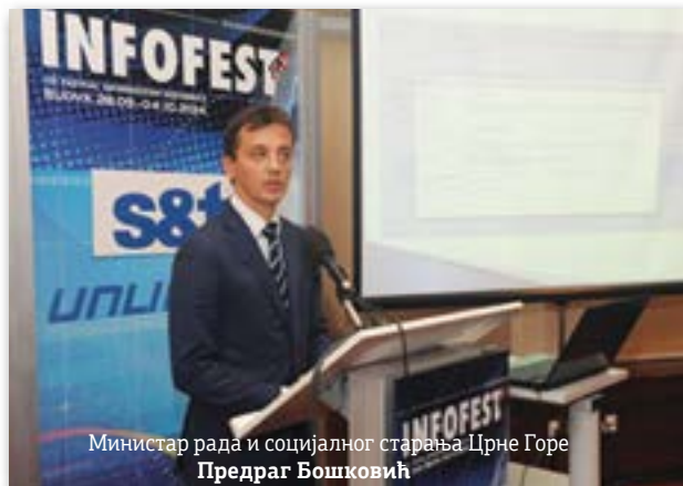
Министар рада и социјалног старања Црне Горе Предраг Бошковић

Систем омогућава бољи увид у кориснике, филтрира оне који не испуњавају услове, смањује број прималаца вишеструких накнада и штеди на административним трошковима. Нови систем смањиће злоупотребе социјалних давања - у Никшићу је 75 корисника, који нису међу живима, примало социјалну накнаду